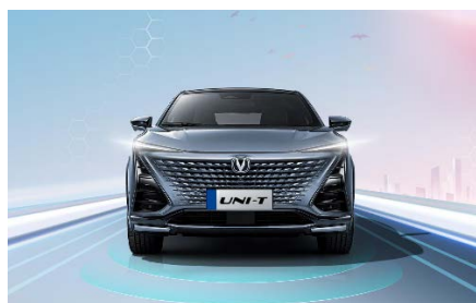
Full-LED передние фары