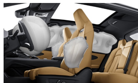
6 подушек безопасности