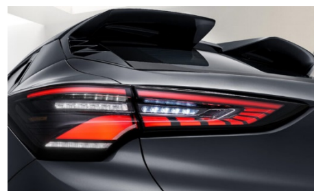
LED задние фары