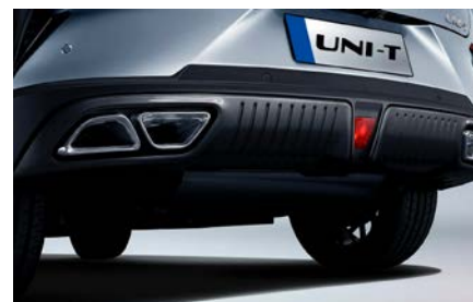
Сдвоенная система выхлопа