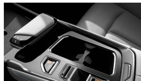
Электронный стояночный тормоз