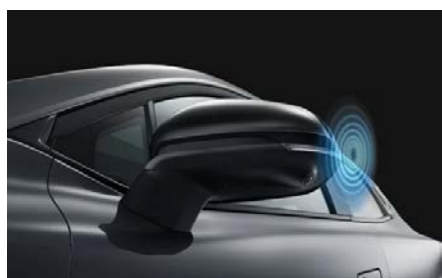
Система контроля мёртвых зон