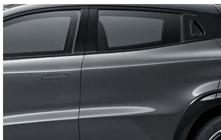
Скрытые дверные ручки