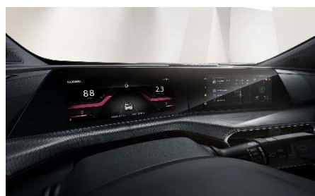
Сдвоенный дисплей 20,6"