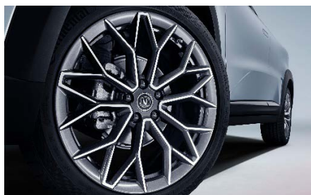
Легкосплавные диски R20